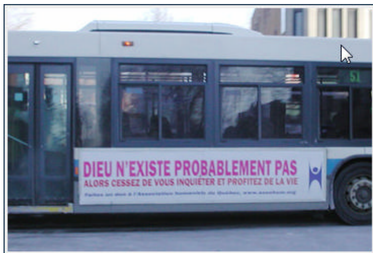
Un des autobus qui a tant fait parler

eu le soutien avoué (en onde et hors d'onde) de plusieurs animateurs d'émission.