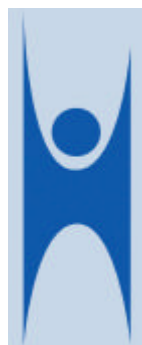
Le logo international des humanistes

« Dans la presse écrite, nous avons eu des chroniques positives un peu partout, en particulier dans La Presse (trois articles). »